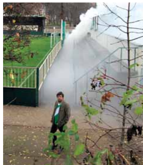
Příznivci Meteoru o sobě dali v poločase vědět dýmovníci. Bylo to tak derby se vším všudy.

Admira tak přezimuje třetí od konce, Meteor je osmý. -red-