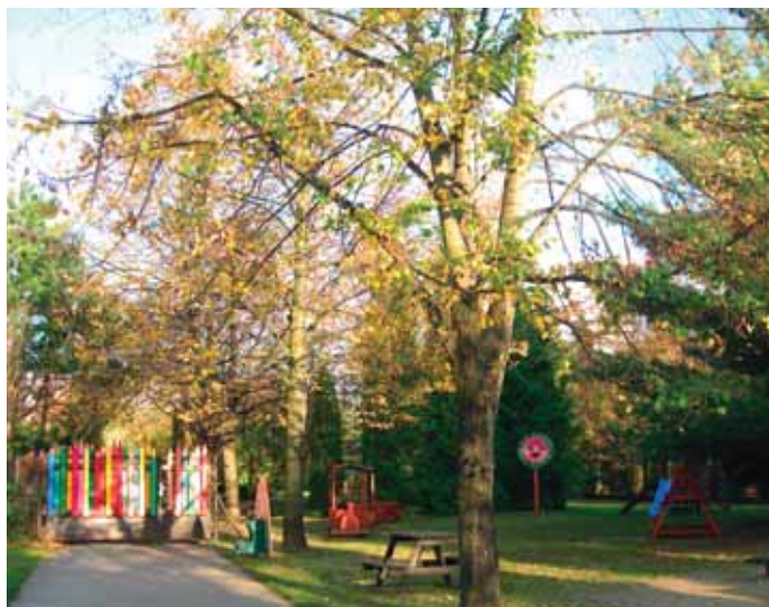
Zahrada nyní působí pohodovým dojmem.