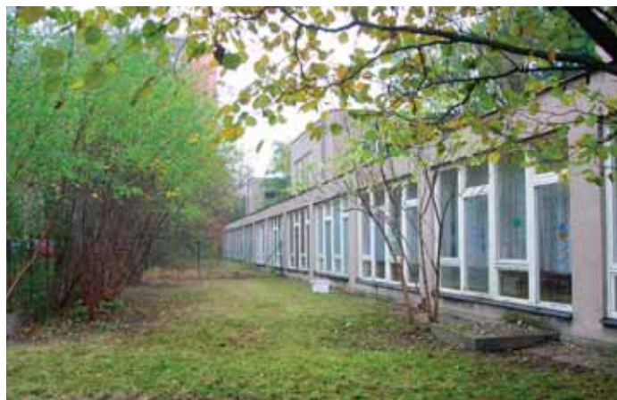
Stejný pohled o pár dní později... po úpravě.