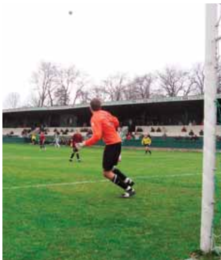
Brankář Admiry lovil míč ze sítě pětkrát, tento centr ale lapil.

Kdo přišel na divizní fotbalové derby mezi Meteorem a Admirou až po patnácté minutě, mohl si rovnou zajít do tamní hospody na pivo a párek. Bylo totiž hotovo.