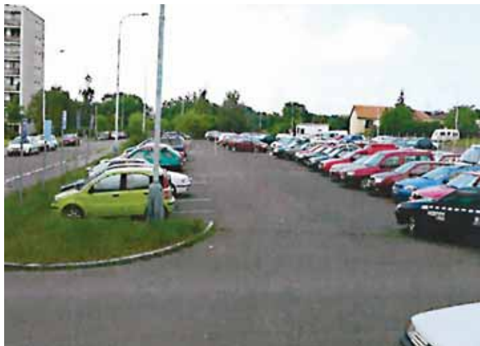
Radnice nesouhlasí ani s možnou výstavbou poblíž Cafourkovy ulice.

Rada osmé městské části z velké míry nevyhověla žádosti Inženýringu dopravních staveb a. s. o posouzení obchodní využitelnosti pozemků nad pět tisíc m 2 ve vlastnictví Hlavního města Prahy. Z celkem sedmi lokalit vedení radnice nedoporučilo k obchodním aktivitám šest celků.