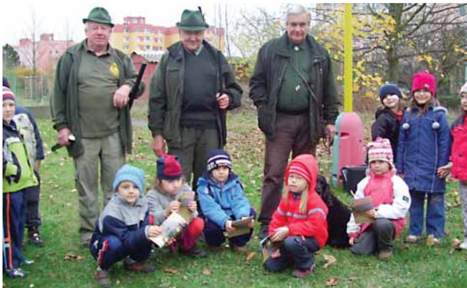
Děti se učily poznávat druhy zvířete, které žijí v českých lesích.

Úřadem Městské části Praha 8 zorganizovaná akce „Kdo si hraje, nezlobí“ přinesla na jedné straně rodičům nejen z bohnického sídliště, kde se v září konala, náměty pro náplň volného času jejich dětí, na druhé straně řadě kulturních, sportovních a dalších organizací příliv nových tváří. Mezi těmi organizacemi byli i myslivci z Obvodního mysliveckého spolku v Praze 8.