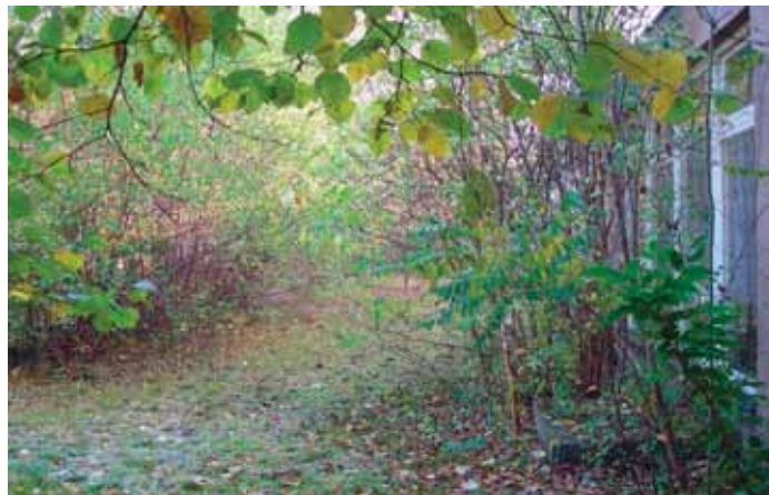
Pohled na severní část budovy před úpravou.