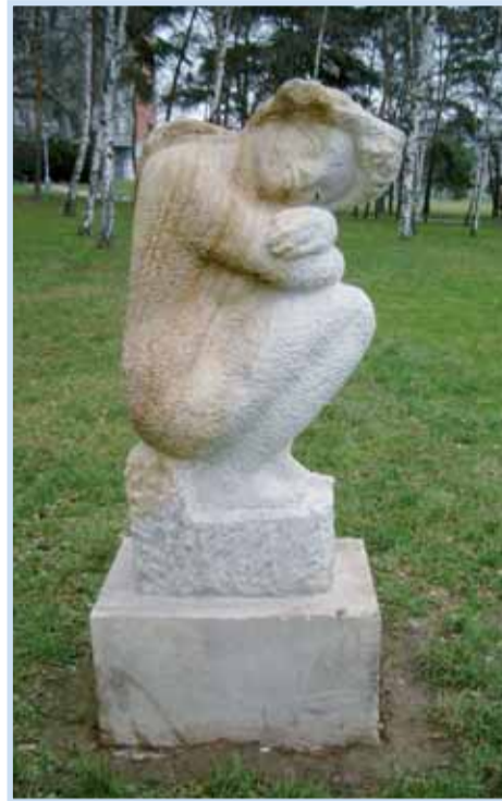
Schoulená dívka, Chabařovická 16a.