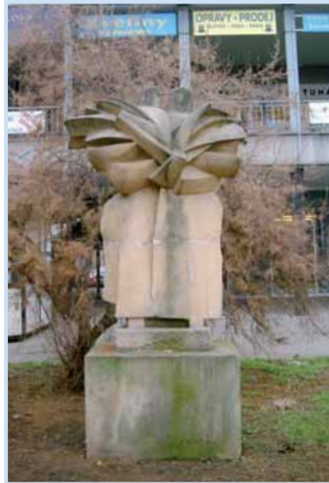
Hodiny botaniky, Hornátecká - Přemyselská.