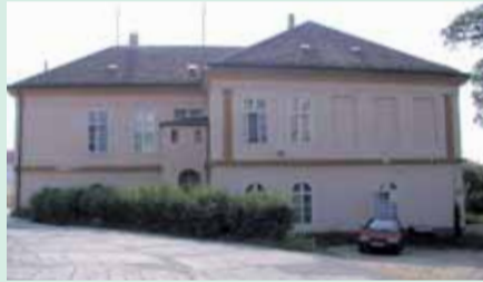
Usedlost Vlachovka, čp. 91, Zenklova 225, Trojská 1.

Nyní se odborníkům podařilo zpracovat do medailonů další desítky usedlostí - celkem jich bylo identifikováno více než tři stovky. Mnohé objekty již dávno nestojí, jiné jsou zrekonstruovány a slouží novým účelům.