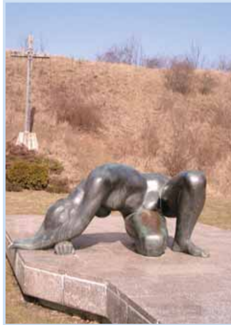
Ležící žena, bronzová plastika „nepokořená vlast“, pietní území Kobyliské střelnice - památník protifašistického odboje.