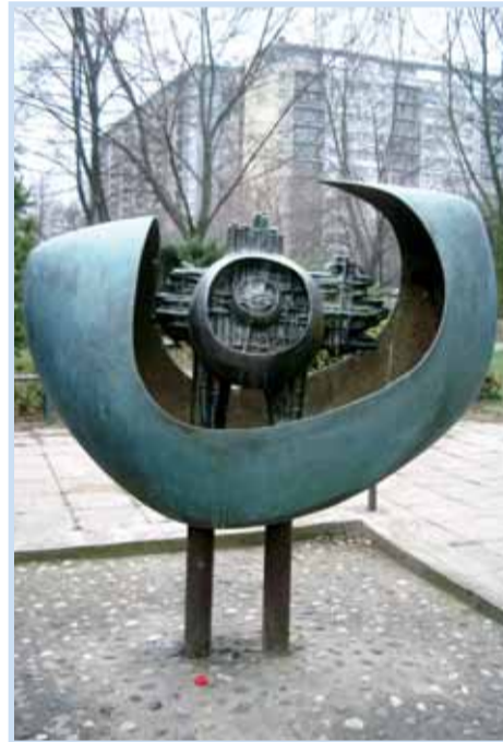
Prameník, Famfulíkova 1.