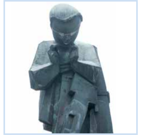
Mateřství, Trousilova ul., před Domem kultury.