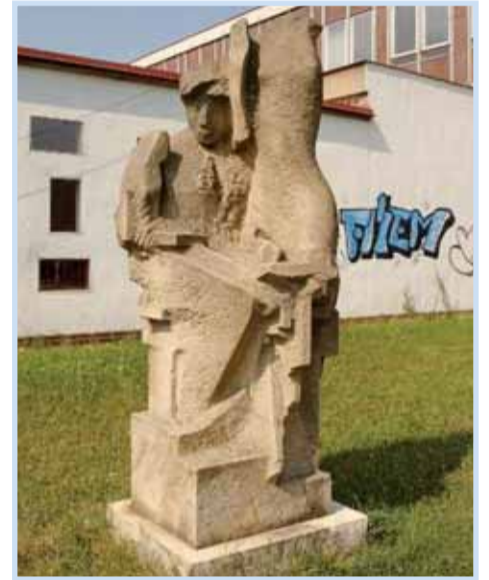
Inspirace, Hovorčovická - Mirovická (u ZŠ Mirovická).