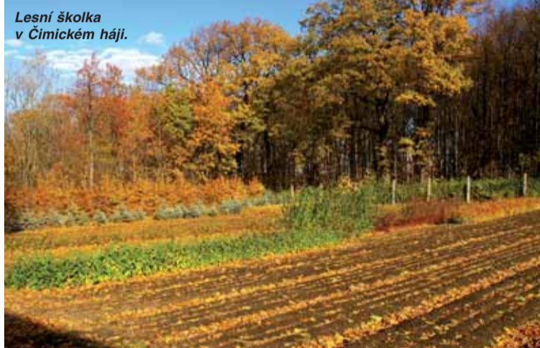
Lesní školka v Čimickém háji.

Pokud máte nějakou zajímavost či poznámku k tématu pražské lesy, napište na tuto e-mailovou adresu: prusova@lesy-praha.cz. -pp-