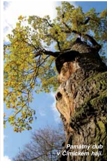
Památný dub v Čimickém háji.

se kolem sazenic seká tráva či ostružiní. To se provádí asi 4 roky od zasazení stromku. Každý podzim je pak potřeba mladé stromky natřít proti okusu zvěří a zhruba od 10 let se musí mladé kultury prořezávat.