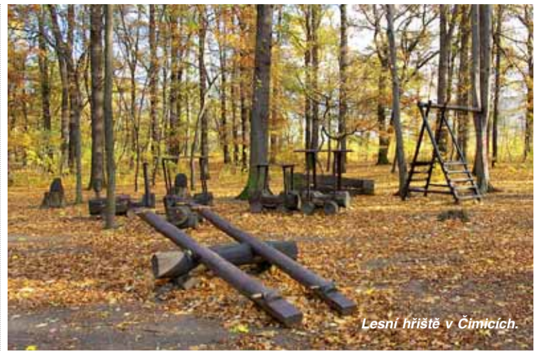
Lesní hřiště v Čimicích.

To zdaleka ne, ta největší práce teprve začíná. Po zalesnění se porosty dvakrát až třikrát ročně tzv. ožínají, to znamená, že