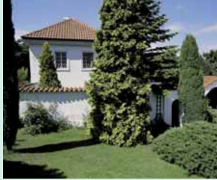
Usedlost Císařská, čp. 76, Prosecká 32. Původně viniční dům z konce 17. století, později usedlost zvaná Na Sovích vrších, pojmenována po jejím majiteli císařském rychtáři.

Do prostoru Sálu architektů na Staroměstské radnici připravil před šesti lety Útvar rozvoje hl. m. Prahy výstavu o viničních a hospodářských usedlostech v okolí historického jádra