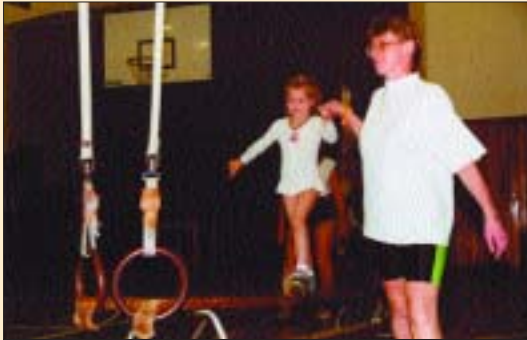
Cvičení sokolského dorostu

všeho věku. Zároveň tak libeňští Sokolové oslavili 90. výročí otevření budovy své tělocvičny.