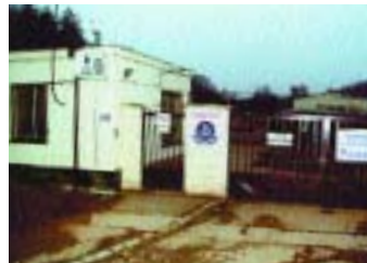
Útulek pro opuštěná zvířata, V Zámčích 56, Praha 8

Trjorský psí útulek má v současné době kapacitu 150 míst pro psy a 80 pro kočky. Jeho provoz je hrazen z rozpočtu města, ale organizačně patří pod Městskou policii. Kapacitu má však natolik napjatou, že vznikla nutnost vybudovat veliký výběh pro psy a novou budovu pro příjem a výdej. Psí a kočičí obyvatelé útulku zkonzumují měsíčně více než tunu krmiva, kterou hradí Unie výrobců krmiv pro psy a kočky. Díky této pomoci ušetří psí domov významnou část svého rozpočtu.