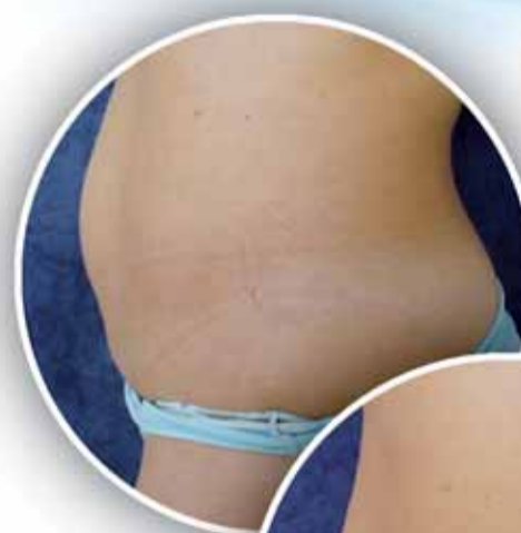
před ošetřením přístrojem Ultrashape