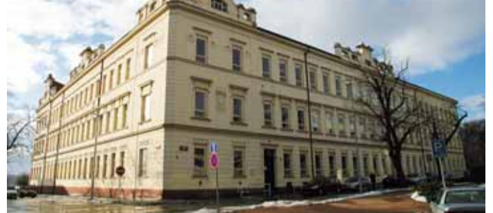
ZŠ Na Korábě.