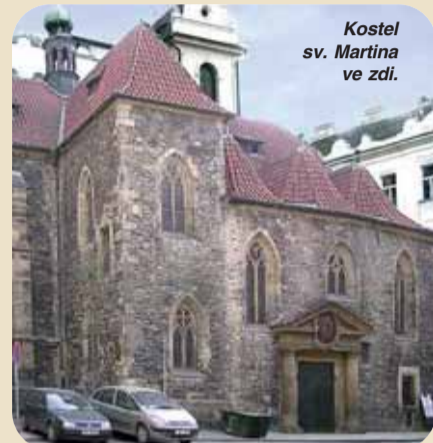
Kostel sv. Martina ve zdi.