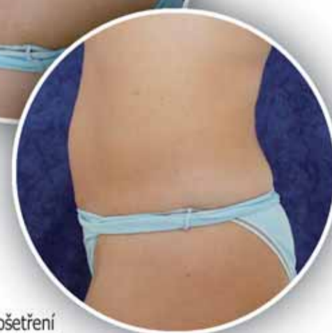
po ošetření přístrojem Ultrashape

Pražské dermatologické centrum spol. s r. o., Na Stráži 28, 182 00 Praha 8