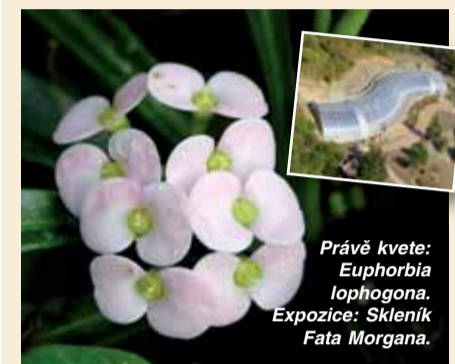
Právě kvete: Euphorbia lophogona. Expozice: Skleník Fata Morgana.