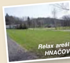
Relax areál HNAČOV

Obvodní ústav sociálně – zdravotnických služeb v Praze 8, Bulovka 10 pořádá REKREACI pro důchodce z Prahy 8