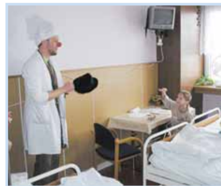
Klaun čistí špatné myšlenky.

GERONTOLOGICKÉ CENTRUM Šimůnkova 1600, 182 00, Praha 8 - Kobylišy Tel.: 286 88 36 76