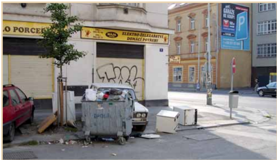
Ulice U Pošty je jedním z nejčastějších cílů pro odkládání vysloužilých lednic - tyto tři byly odloženy během jediného dne!