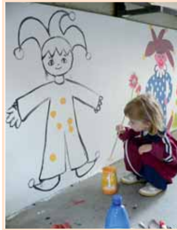
Maluje se a maluje.