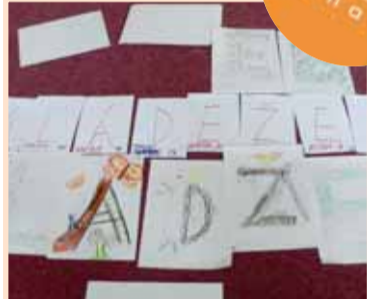
Připravují se návrhy.