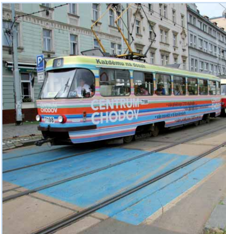
Reflexní nátěry přechodů pro chodce umožňují bezpečnější přecházení.

Drahaně, kde byl podchod v takovém stavu, že ho školáci stejně často nepoužívali. Proto jsme se domluvili s TSK na jeho vyčištění a novém omítnutí,“ říká Hoznauer a dodává: „Důležité je ale hlavně to, aby dětem šli příkladem dospělí, ať už jejich rodiče, nebo učitelé. Děti se musí naučit, že