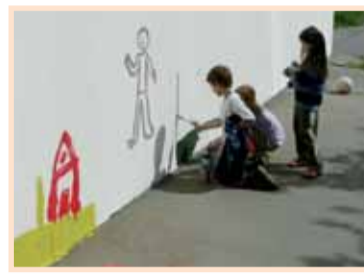
Zapojily se i kolemjdoucí děti.