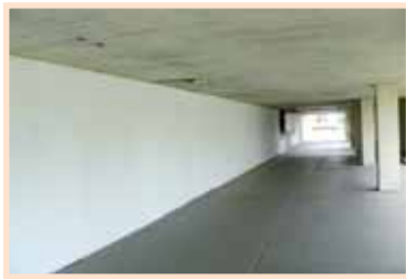
Bílé zdi čekají.

Skupina dětí a několika dospělých strávila jednu celou červnovou sobotu v příjemném tvůrčím rozpoložení. Formou hry se nejdříve na svět vyklubaly náměty, poté došlo na jejich návrhy na papíře a následovaly namíchání vhodných barev a samotná realizace. Tě předcházelo vybělení všech plechových ploch a vyčištění dřevěných panelů pro výlep plakátů.