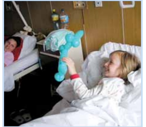
Výsledek měření tlaku od Zdravotního klauna.