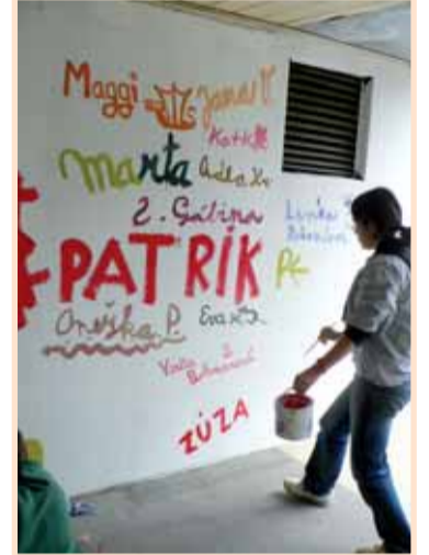
Nechyběl elán ani odhlodlání.

volného dne, pohled na dobře vykonanou práci a pochvala neznámých kolemjdoucích. Všichni si přejí, aby se vandalové obrázkům co nejdříve vyhýbali.