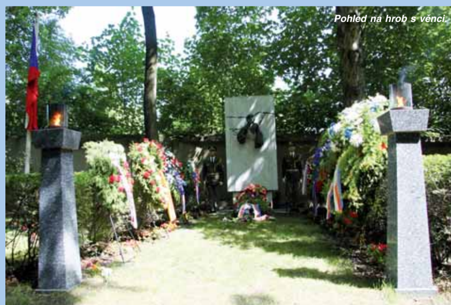
Pohled na hrob s věnci.

Ve všech projevech zazněla slova o nutnosti stálého připomínání hrdinství i obětí lidí všech věkových kategorií včetně dětí, kteří v období komunismu položili své životy. Zazněla i slova lítosti nad tím, že se tohoto aktu nezúčastnili