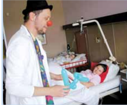
Konec měření krevního tlaku klaun proměnil v jezevčíka.