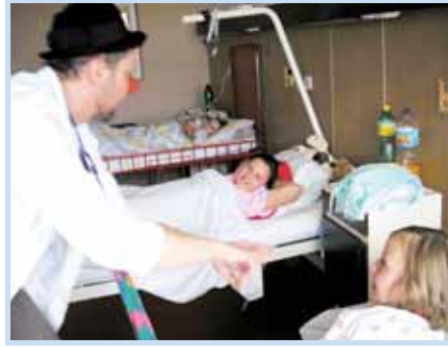
Zdravotní klauni u dětí na ortopedické klinice.

Byla to dvojice Zdravotních klaunů, jejímž hlavním úkolem je léčba smíchem, jako je například měření dobré nálady dětského pacienta, čištění špatných myšlenek či neobvyklé měření krevního tlaku, na jehož konci je z výsledku vykouzleno roztomilé zvířátko, které pacient dostává za odměnu. Pro každého dětského pacienta měla dvojice Zdravotních klaunů připraveny kouzla, gagy, a hlavně spoustu zvonivého smíchu. Svoji návštěvou naše dětské pacienty potěšili a hlavně přispěli dobrou náladou jako součástí léčebného procesu. -jk-