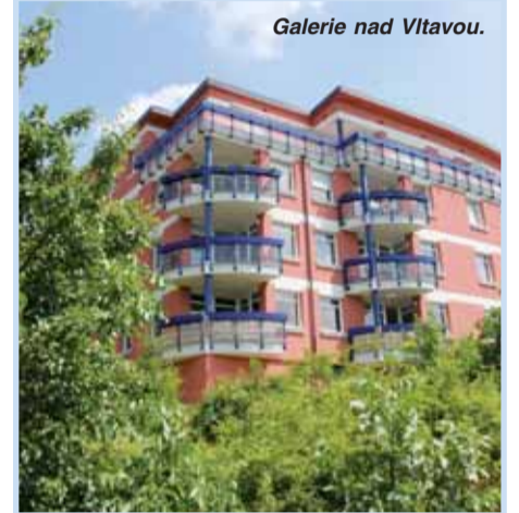
Galerie nad Vltavou.

Já už jsem zmínil, že bychom rádi rozjeli výstavbu družstevních bytů na neziskovém principu. Předpokládáme tady určitý podíl městské části, a to hlavně na správě pozemku a iniciování vzniku