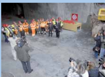
Úspěšné proražení jižního tunelu 23. 5. 2006

prováděla se ochrana a přeložky inženýrských sítí. Jednoduché nebylo ani odstraňování zeleně pro portály budoucích tunelů, a to nejen vzhledem k těžko přístupnému terénu ve svahu Vítkova, ale také s ohledem na respektování zásady co nejmenšího množství likvidovaných stromů.