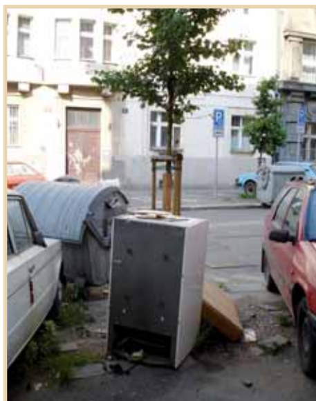
Vzácný strom jinan dvojlaločnatý v ulici U Pošty by mohl dlouze vyprávět o počtu starých lednic, které se o něj již opíraly.

Cesta do sběrného dvora či ke kontejneru je cestou slušných lidí, kteří ctí etická pravidla ve vztahu k okolí a obecně k životnímu prostředí. Odpo-