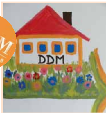
Jeden z obrázků.

Každý zpracovatel si svůj návrh přenesl na plochu a zvolil barevné kombinace. Nebylo možné přeslechnout poznámky