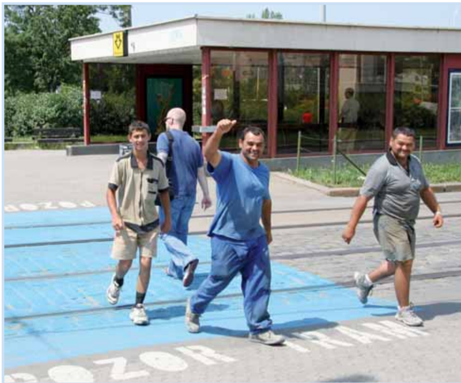
Bezpečné přechody nechybí ani na Palmovce.

Zvýrazněné přechody pro chodce v okolí škol se budou objevovat postupně, radnice chce využít i peněz z dopravního fondu Besip. Úprava přechodů ale není jediným opatřením pro větší bezpečí školáků na ulicích. „Postupně se snažíme snižovat rychlost v okolí škol a tam, kde to jde, budujeme i zpomalovací prahy. Snažíme se i zlepšovat stav podchodů, to je třeba případ