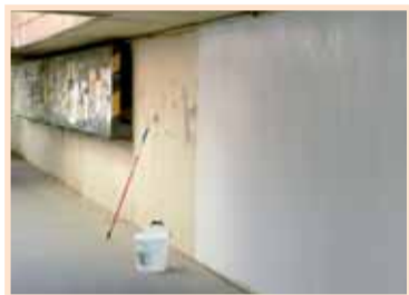
Příprava na malování.