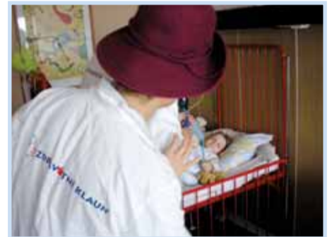
Měření krevního tlaku...