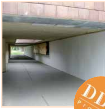
Připravují se návrhy.

Skupina dětí a několika dospělých strávila jednu celou červnovou sobotu v příjemném tvůrčím rozpoložení. Formou hry se nejdříve na svět vyklubaly náměty, poté došlo na jejich návrhy na papíře a následovaly namíchání vhodných barev a samotná realizace. Tě předcházelo vybělení všech plechových ploch a vyčištění dřevěných panelů pro výlep plakátů.