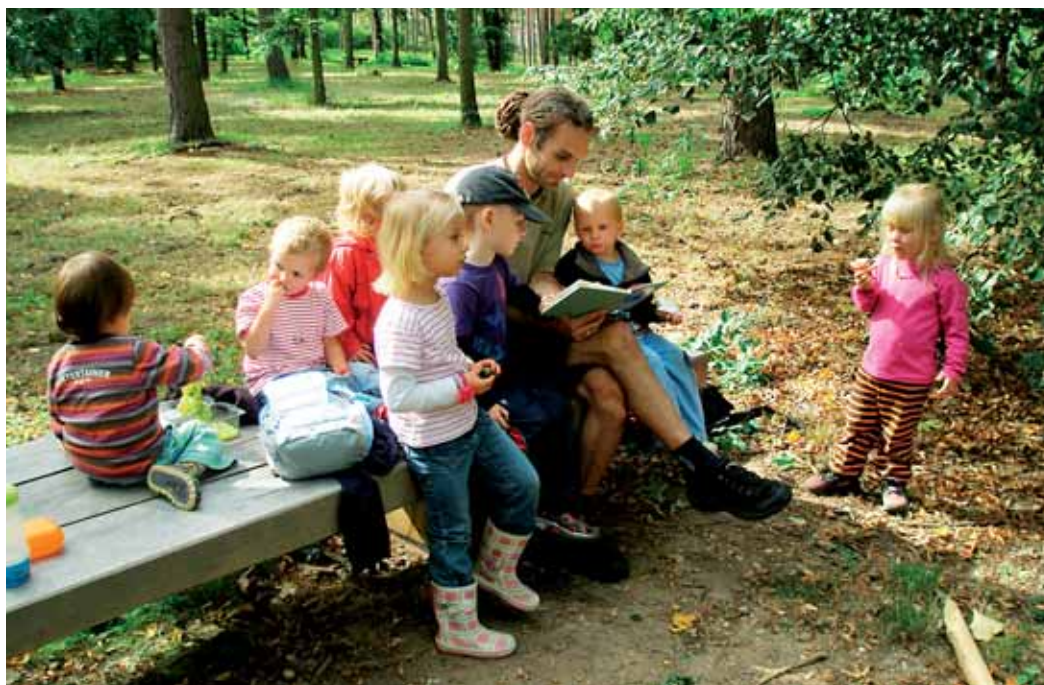
Škola se dětem snaží nabídnout bezpečné a přirozeně přátelské prostředí