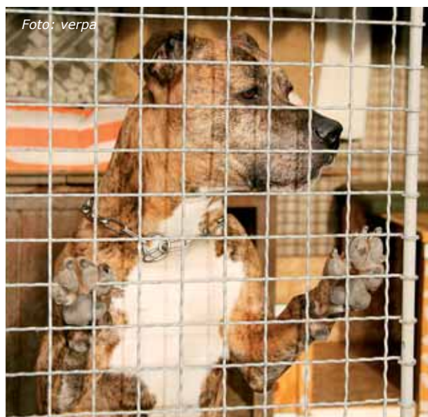
Posledním přírůstkem v útulku je kříženec jménem Brit

lice vítána), a to na číslo účtu 2800181056/2010. Pro více informací navštivte internetovou stránku www.utulek-liben.com .