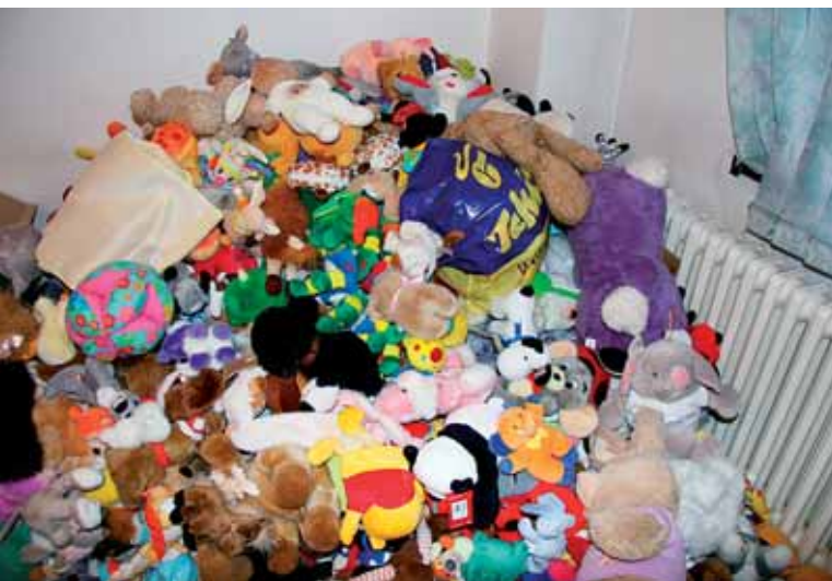
Charitativní akce dětem přinesla stovky hraček

uvedla po skončení sbírky radní Markéta Adamová, z jejíž iniciativy a pod jejíž záštitou se celá akce uskutečnila. „Asi polovina věcí již našla své nové majitele, avšak stále jich je dost na to, abyste si i vy mohli přijít vybrat hračku nebo nějaký kus oblečení pro své děti. Zveme vás proto na netradiční tříkrálový bleší trh do Kulturního domu Ládví,“ informoval zastupitel Prahy 8 Michal Švarc, který zajišťuje logistiku a organizaci sbírky.