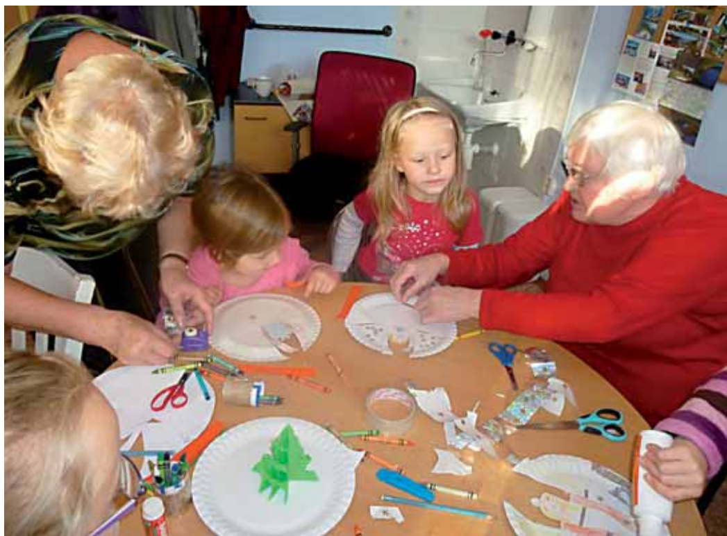
Děti spolu se seniory vyráběly drobné vánoční dárky a dekorace

Předškoláčky ze třídy Žirafek z Mateřské školy v Šimůnkově ulici našli své starší přátele hned za plotem zahrady, v sousedícím Gerontologickém centru. Stalo se již dobrou tradicí, že s vánočním programem přicházejí osvěžit seniory do jejich prostor, avšak v loňském prosinci došlo i k něčemu zcela novému. Děti a babičky se sešly poprvé ve společné vánoční dílně a vyráběly drobné dárky a dekorace. Sluníčko ten den přes okna krásně svítilo, aby bylo na tu práci lépe vidět, vánoční hudba z přehrávače potichu hrála, aby se všichni cítili ještě svátečněji, a sušenky s čajem dodaly