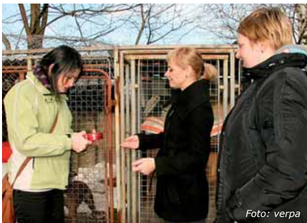
Zástupci zaměstnanců ÚMČ Praha 8 předali provozovatelce útulku příspěvek na provoz

Milovníci psů mohou útulku vypomáhat jak věcnými dary (deky, jídlo), tak i brigádně. V neposlední řadě lze přispět i finančně (každá částka je ve-