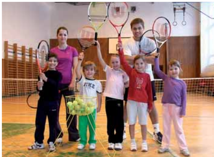
Tenisová škola Tallent působí na ZŠ Glowackého

Tenis již není sportem, který je spojován s přívlastky jako drahý či nedostupný. Není třeba dojíždět za tenisem přes celou Prahu, protože v blízkosti vašeho bydliště probíhají kurzy - v Praze 8 trénujeme na Základní škole Glowackého v Troji. Odpoled-