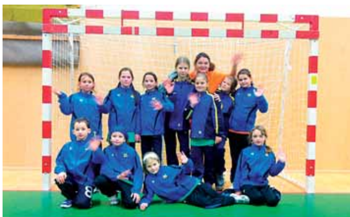
Házenkářky Sokola Kobylisy II vyhrály turnaj v Turnově

V dalším zápase jsme narazily na družstvo Pardubic, se kterým jsme před týdnem prohrály o tři branky. Nicméně se nám podařilo soupeře zaskočit důslednou osob-