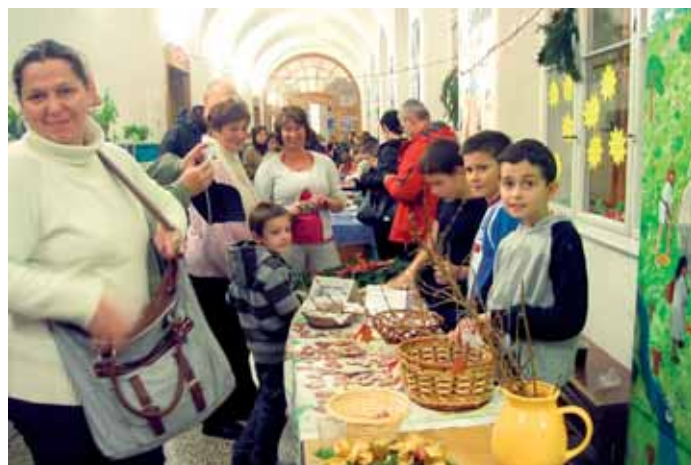
Návštěvníci jarmarků si v obou školách mohli zakoupit typické vánoční produkty