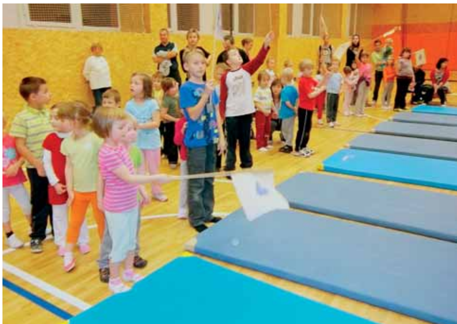
Softbalový klub Joudrs se díky velkému zájmu rozhodl rozšířit sportování pro nejmenší

V kroužcích nazvaných „Sportování pro nejmenší“ dbají zkušení trenéři především na všestranný sportovní rozvoj a atletickou přípravu se zacílením na rychlost, obratnost a týmovou spolupráci. Se softbalem ani jinou sportovní specializací se v těchto kategoriích malí cvičenci nesetkají. Hlavním záměrem je vést děti ke sportu jako takovému a komplexně rozvíjet jejich tělesnou zdatnost a všechny sportovní dovednosti – správné běhání, ohebnost, rychlost, kondici, reakci, pružnost, koordinaci a v neposlední řadě vzájemnou komunikaci a spolupráci v týmu. Vše především formou zábavy a her.