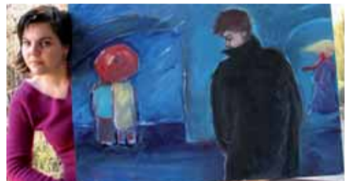
DIVADLO KÁMEN / vernisáž výstavy Jany Julínkové