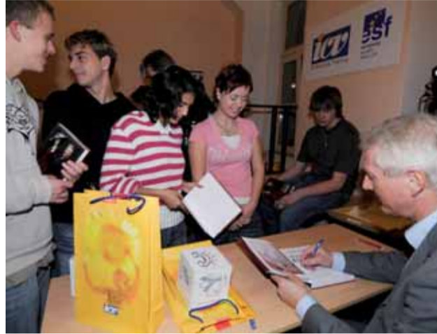
Slavnostního předávání certifikátů spokojeným absolventům projektu Věřím si se zúčastnil i bývalý mluvčí Václava Havla – PhDr. Ladislav Špaček, který dětem zároveň podepsal svou Velkou knihu etikety.