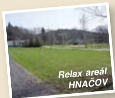
Relax areál HNAČOV

Obvodní ústav sociálně – zdravotnických služeb v Praze 8, Bulovka 10 pořádá REKREACI pro důchodce z Prahy 8