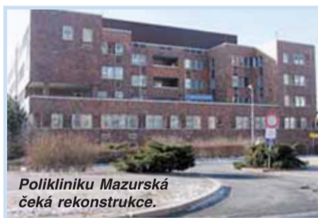
Poliklinika Mazurská čeká rekonstrukce.

Běžné výdaje, které jsou určeny na zajištění provozu a rozvoje městské části, se předpokládají ve výši 579,6 milionu korun. Nejvyšší položky se týkají nákladů na městskou infrastrukturu (47,4 milionu určených na sběr a svoz odpadů, ochranu přírody a krajiny, péči o vzhled obce a veřejnou zelen) a na zdravotní a sociální oblast (55,6 milionu například na protidrogovou prevenci či na dotace