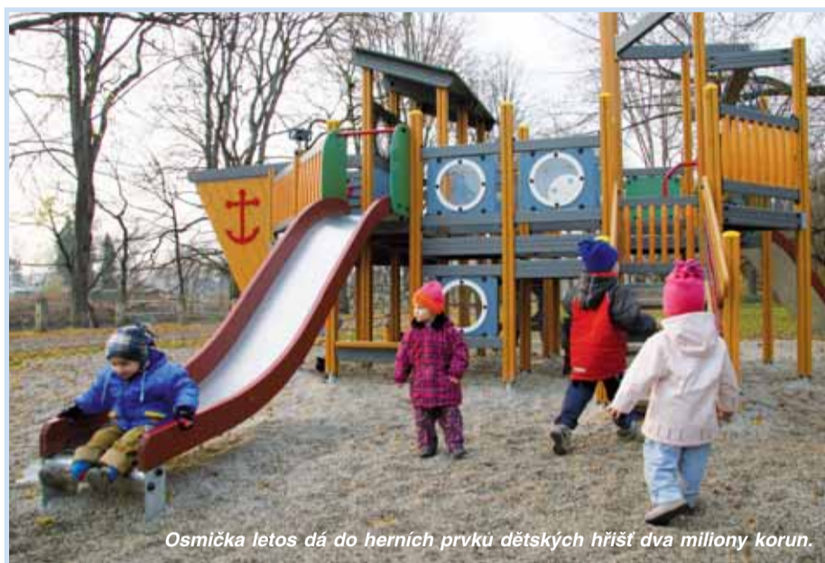
Osmička letos dá do herních prvků dětských hřišť dva miliony korun.

V oblasti příjmů se nejvyšší prostředky očekávají z přijatých transferů, a to z vlastních fondů hospodářské, zdaňované činnosti (265,3 milionu korun), z dotace Hlavního města Prahy (233,8 milionu) a z neinvestiční dotace ze státního rozpočtu určené na výkon státní správy a školství (47,5 milionu). Dalšími položkami jsou daňové příjmy v celkové výši 91,1 milionu, zejména správní poplatky (26,1 milionu), daň z nemovitostí (26 milionů), místní poplatky za provozované výherní hrací přístroje (16 milionů), odvod výtěžku z provozování loterií (10 milionů) a místní poplatek za užívání veřejného prostranství (8,8 milionů).