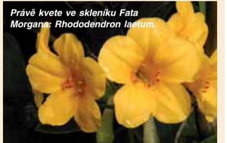
Právě kvete ve skleníku Fata Morgana: Rhododendron laetum.