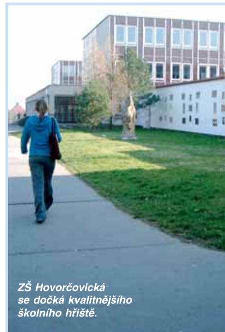
ZŠ Hovorčovická se dočká kvalitnějšího školního hřiště.