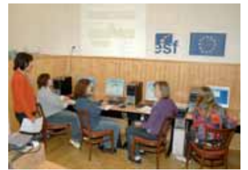
Šest nových pracovních míst, která slouží jako zázemí pracovním místům.

KOUPÍM BYT , nebo rod. dům jakékoli velikosti, kategorie a vlastnictví, kdekoliv v Praze. Nabídněte cokoli, možno i dekret - nájemní smlouvu, i v domě s majitelem, podnikový a pod. I zdevastovaný, v soudní žalobě, neoprávněně obsazený, s nežádoucím nájemníkem, či s jakoukoli právní vadou. Veškeré formalisty zajistím, zaplatím stěhování i případné dluhy na nájemném, privatizaci atd. Mohu sehnat a zaplatit