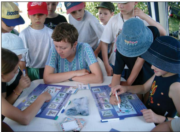
Na tematicky zaměřených stanovištích se děti formou her učily chránit před úrazy.