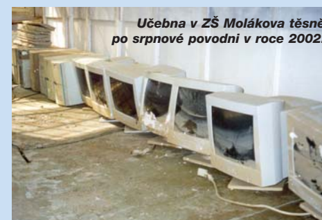
Učebna v ZŠ Molákova těsně po srpnové povodni v roce 2002.

během června začaly probíhat rekonstrukční práce. Celková výše nákladů rekonstrukce tohoto areálu včetně technologie kuchyně se dostává až do výše 50 miliónů korun. Předpoklad ukončení oprav všech pavilonů je první čtvrtletí nového školního roku. Z toho je zřejmé, že nový školní rok jak mateřinka,