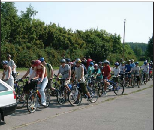
Během akce projel bohnickými ulicemi peloton dětských cyklistů v doprovodu hlídek Policie ČR a Městské policie.