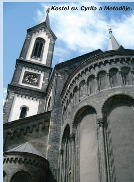
Kostel sv. Cyrila a Metoděje.

Desítky velkorozměrových fotografií, zachycující atmosféru loňských katastrofálních povodní, je stále možné spatřit v přízemních prostorách Grabovy vily v ulici Na Košince. Výstava je přístupná veřejnosti v úředních hodinách, tedy v pondělí a ve středu.