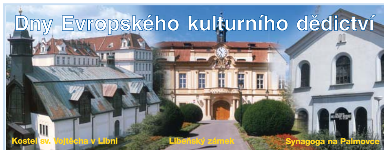
Kostel sv. Vojtěcha v Libni Libeňský zámek Synagoga na Palmovce

Jak jsme již upozornili v srpnové Osmičce, dne 6. 9. 2003, to je v sobotu, proběhne Den Evropského kulturního dědictví, lidově zvaný Den otevřených dveří památek, pořádaný v naší republice Sdružením historických sídel Čech, Moravy a Slezska.