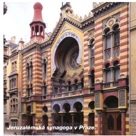
Jeruzalémská synagoga v Praze.

7. 9. pořádá tyto akce: - zpřístupnění židovského hřbitova na Žižkově od 10.00-13.00 (vstup zdarma) - přednášky: 10.00-11.00 hodin - A. Pařík - „Pražský Globetrotter“ (o Robertu Guttmanovi)