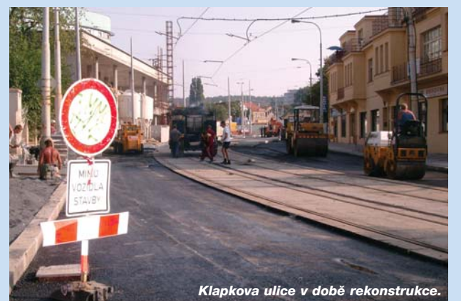
Klapkova ulice v době rekonstrukce.