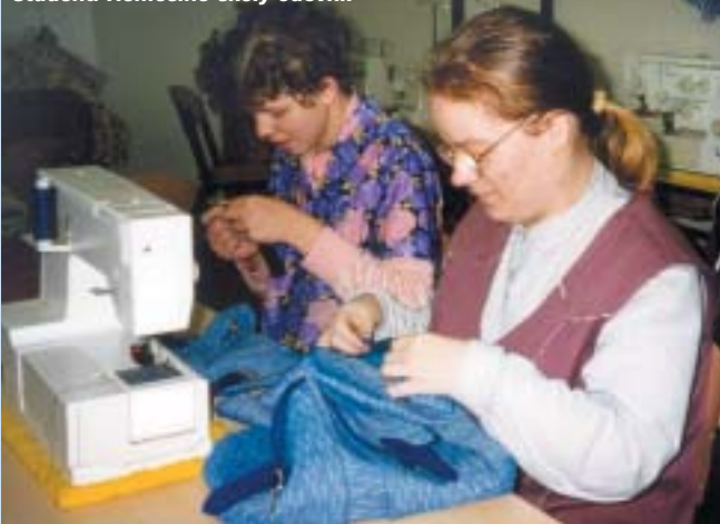
Studenti Řemeslné školy oděvní.

na budoucí drobné podnikání v okolí svého bydliště (ale až po získání praxe v provozu). Vyučující kladou důraz na přípravu střihů, na různé techniky a zákonitosti střihání, zkoušení oděvů s využitím zakázkové a sériové technologie. V hodinách ekonomiky se žáci seznamují s rozpočtem a vedením budoucí domácnosti, popř. malé živnosti s praktickou přípravou pro řemeslnou propagaci - dá se říci, že studují „marketing“.