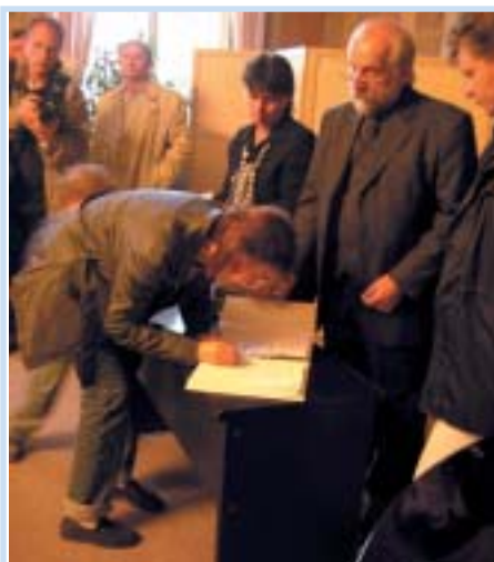
Pomoc byla určena výhradně pro rodiny s dětmi, jejichž byty voda v loňském srpnu totálně vyplavila.

Dalších devětasedmdesát karlínských rodin obdrželo od hamburské samaritánské organizace finanční pomoc v souvislosti s loňskými povodněmi. Na předávání prostředků se podíleli i představitelé radnice osmé městské části, kteří samaritánům úspěšně pomáhali akci koordinovat i vytipovávat vhodné příjemce darů.