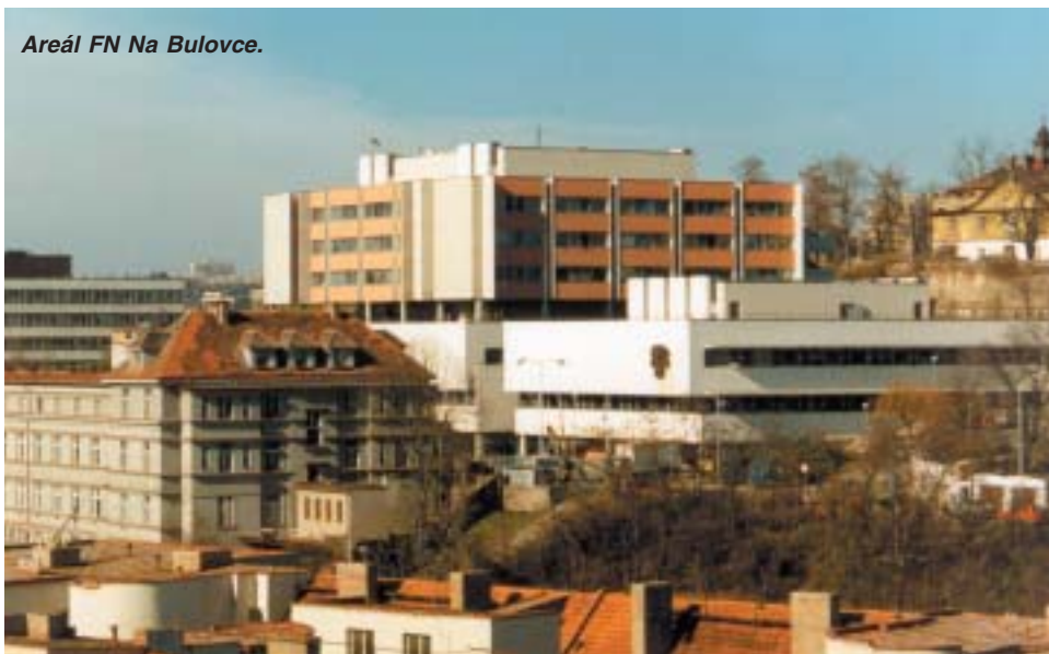
Areál FN Na Bulovce.

první světovou válkou. V letech 1914 -1915 zde na vršku nad Vltavou a dále od samotného centra města Prahy byl vystavěn a otevřen infekční pavilon, který byl z odborného hlediska zaměřen spíše na léčbu tuberkulózy. Další plány rozvoje pak přerušila první světová válka. Po skončení válečného dramatu se začalo s projektováním nové moderní pražské nemocnice. Vláda Československé republiky svým usnesením ze dne 21. května 1931 přiznala právo veřejnosti užívat všechny služby