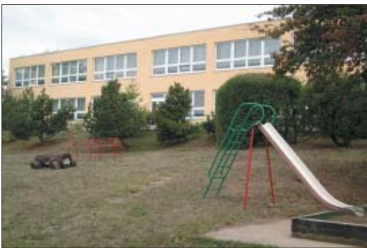
Stavební úpravy proběhly vně a částečně i uvnitř budovy.

Stavební úpravy se odehrály vně a částečně i uvnitř budovy. Tvar a tektonika fasády doznala změny u uličního pohledu, kde došlo k vyždění parapetů oken, a tím ke zmenšení prosklené plochy. Dále došlo k výměně oken a dveří, k zateplení obvodových stěn a střechy. Na chodbách byly instalovány radiátory ústředního topení a byly provedeny úpravy v kotelně a ve školnickém bytě, které povedou k ekonomičtějšímu provozu mateřinky.