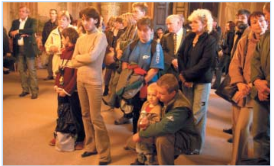
Hamburští samaritáni přispěli nejen rodinám vyplaveným velkou vodou, ale i na rekonstrukci povodněmi poškozených škol na Lyčkově náměstí a v Molákově ulici.

Hamburská samaritánská organizace poskytla dalších pětadvacet milionů korun na rekonstrukci povodněmi poškozených škol na Lyčkově náměstí a v Molákově ulici. Prostředky z této pomoci se již začaly čerpat, náklady na opravy jsou postupně ze