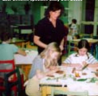
Žáci Církevní speciální školy Don Bosco

Salesiánskou inspekcí a Arcibiskupstvím pražským druhému jmenovanému, které je jejím současným zřizovatelem.