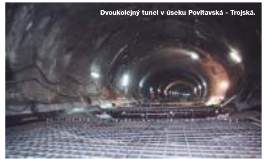
Dvojkolejný tunel v úseku Povltavská - Trojská.