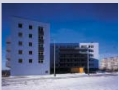
Nový obytný dům v Olštyňské ulici.

Z původně navržených 106 bytových jednotek došlo ke změně na standardních 126 bytových jednotek a 6 ateliérů (to z důvodů dodržení normy na oslunění). Z celkového množství je 7 bytů vybaveno pro vozíčkáře. Stavba má 6 nadzemních podlaží s celkovou obytnou plochou 5 997 m 2 . Převahu bytů tvoří garsoniéry. Všechny byty mají garážová stání, uskladňo- vací komory, vodoměry, měřiče tepla a další moderní vybavení. Dům má 2 výtahy a 3 schodiště a je v něm 100 m 2 komerčních ploch.