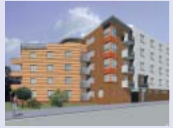
Budoucí podoba obytného domu Vila Sára.