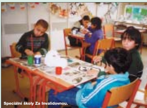
Speciální školy Za Invalidovnu.

centrum. Nejstarším dílem zařízení je škola zvláštní, která již v 70. letech minulého století působila v areálu Základní školy Glowackého. Škola přijímá jak žáky s vadami řeči, tak i v kombinaci s mentálním postižením. Logopedická péče plyne postupuje všemi předměty, přičemž zdejší žáci se orientují na sportovní, hudební a výtvarnou činnost. Důraz je též kladen na praktické činnosti, na získávání praktických vědomostí a dovedností potřebných pro zapojení do běžného života občanské společnosti, na manuální zručnosti a návyky. Škole narůstá počet dětí, již nyní jich má přes 130. Pravidelně se účastní sportovních soutěží speciálních škol a pořádá celodenní tématické zájezdy třídních kolektivů. Při škole pracuje 11 zájmových kroužků, do kterých dochází skoro stovka dětí.