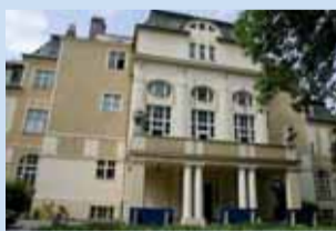
Budova ČRo Regina, dříve Národního domu, který slaví 95 let.