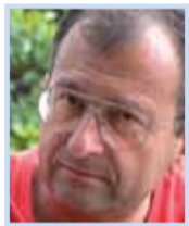
Cyrl Hösch Psychiatrické centrum Praha

Kontakt: Psychiatrická léčebna Bohnice, Ústavní 91, tel.: 284 01 61 11. Linka důvěry, tel.: 284 01 66 66.