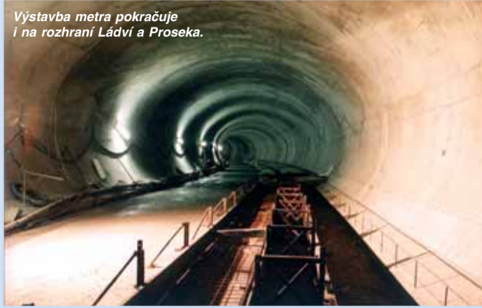
Výstavba metra pokračuje i na rozhraní Ládví a Proseka.

vat,“ řekl mluvčí Metrostavu Polák a dodal: „Nejzajímavějším momentem letošního jara byla jednoznačně vý-