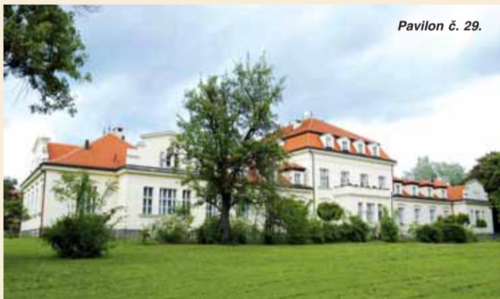
Pavilon č. 29.