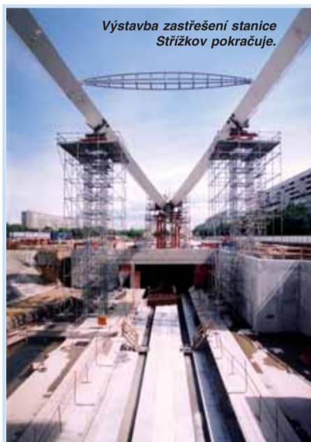
Výstavba zastřešení stanice Střížkov pokračuje.

V závěru května byla slavnostně otevřena stanice metra Hostivař. Nová konečná trasy A leží sice v katastru Malešic, ale zdejší depo se tradičně jmenuje Hostivař, po kterém převezme název i nová stanice. „Stanici Hostivař najdete u ulice Sazečské, kousek za bývalou konečnou