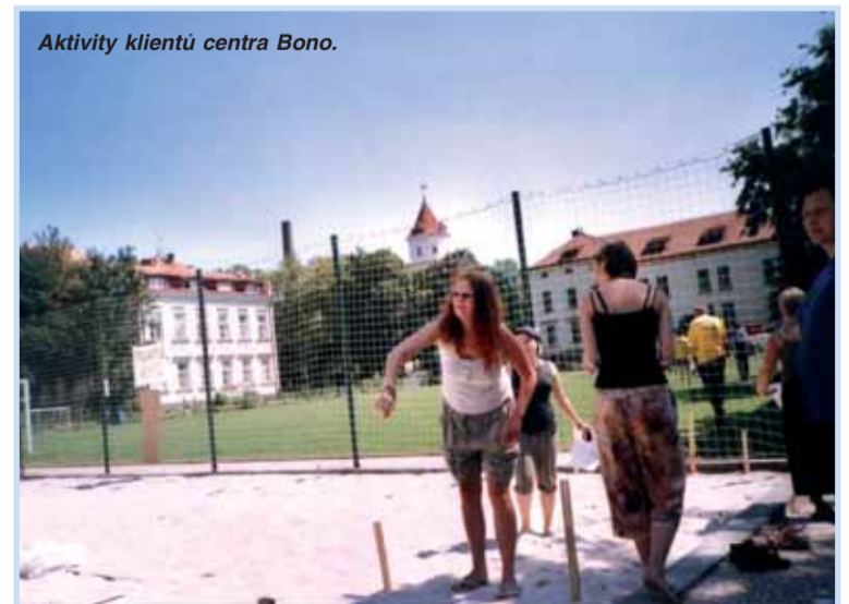
Aktivita klientů centra Bono.

Ano jedná se o 15. výročí. Slouží lidem v kritických životních situacích. Tyto služby jsou pro větší sídla naprosto nutné. Nejde jen o linku důvěry, jde i o možnost zůstat krátce na lůžku, tam kde je to nutné - prakticky anonymně. Toto zařízení představuje pro léčebnu ekonomicky ročně ztrátu asi 3 mil. Kč, chceme ho zachovat, ale je třeba uvažovat o získání podpory z jiných zdrojů, než jsou platby od pojišťovny, a také o možná úspornějším provozu.