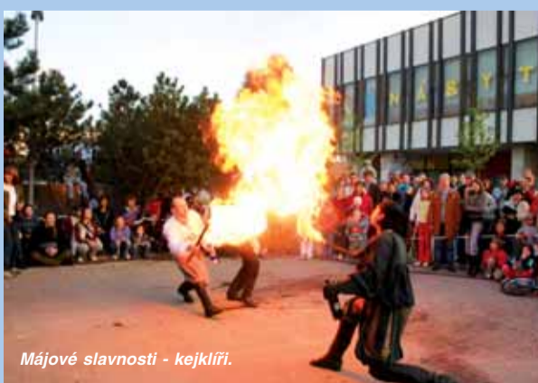
Májové slavnosti - kejklíři.