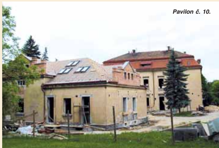
Pavilon č. 10.