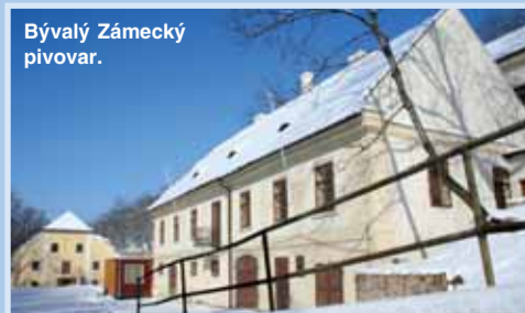
Bývalý Zámecký pivovar.

Bližší informace na www.praha8.cz - odkaz Úřední deska, popř. e-mailem petr.svo-boda@p8.mepnet.cz .