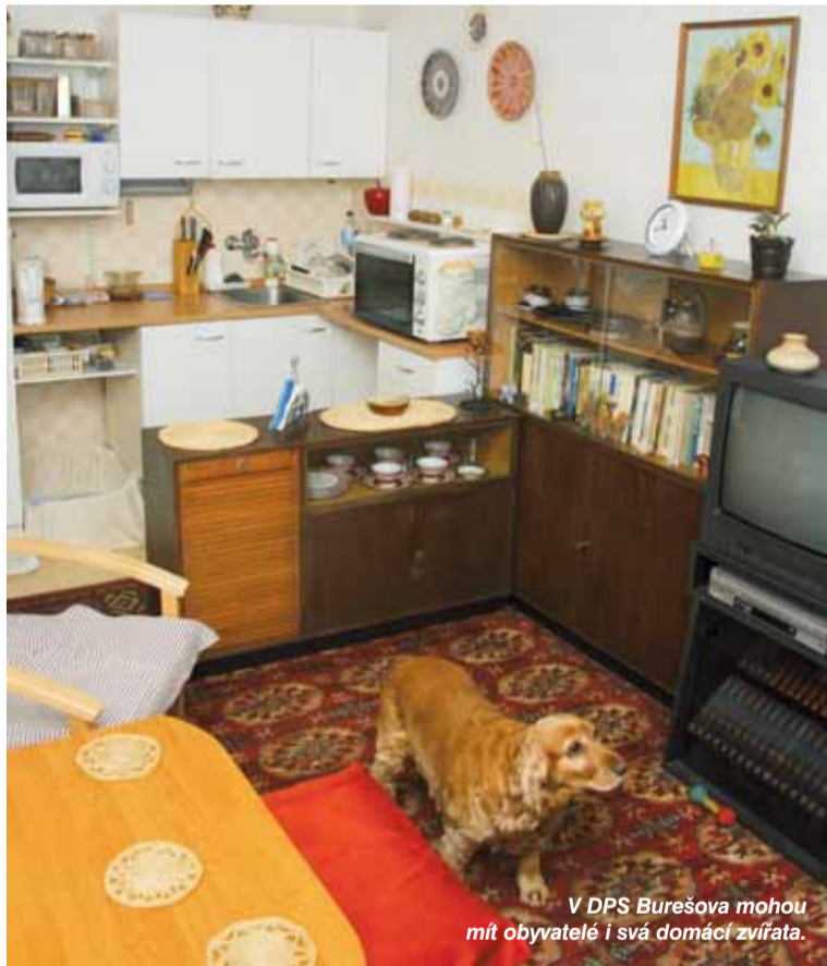
V DPS Burešova mohou mít obyvatelé i svá domácí zvířata.

Jaká jsou úskalí tak velkého zařízení? - M. Holá