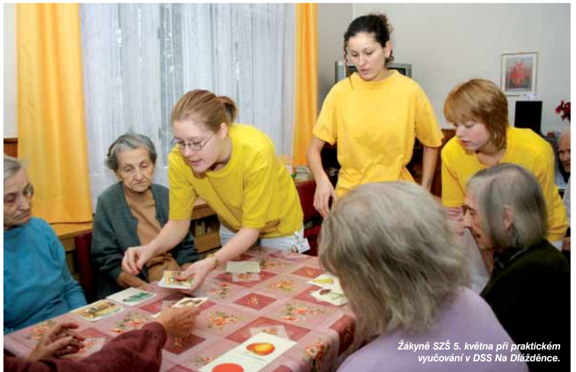
Žákyně SZŠ 5. května při praktickém vyučování v DSS Na Dlážděnce.

Úhrada za pobyt a stravování se řídí příslušnými vyhláškami MPSV, které zahrnují částku za pobyt, stravovací jednotku a částku za nezbytné služby-péči. Denní částka je 200 Kč včetně stravování. V případě, že je občan osamělý, nemajetný a jeho důchod neodpovídá finančnímu pokrytí této péče, kterou nutně potřebuje, řešíme situa-