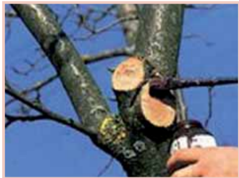
I letos dojde ke zmlazování keřů a zdravotním řezům na stromech.

Pracovníci Odboru životního prostředí se ale chystají i na další činnosti. Mnohem větší pozornosti se letos dočkají nepořádky, kteří ztrpčují život svému okolí věčným nepořádkem. Ve spolupráci s měst-