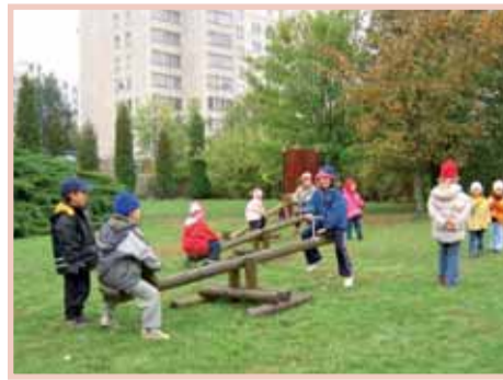
V ZŠ a MŠ Dolákova proběhne rozsáhlá rekonstrukce školního hřiště.

Desítky základních škol Městské části Praha 8, které mají zrekonstruováno sportovní hřiště, dostane 200 tisíc korun na zajištění jeho bezproblémového chodu prostřednictvím správce hřišť. Dříve musely školy prostředky na zajištění této činnosti složitě hledat ve svém rozpočtu. Protože tato hřiště v odpoledních hodinách a o víkendech využívá i veřejnost, rozhodli