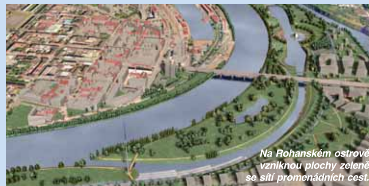
Na Rohanském ostrově vzniknou plochy zeleně se sítí promenádních cest.

V jižní části revitalizovaného území, na Rohanském ostrově, vzniknou plochy přírodní zeleně se sítí promenádních cest, které bude nově definovat dominanta jehly coby prostorového a světelného akcentu území. V soutoku horního a dolního karlínského ramene Vltavy vznikne přístupný atraktivní prostor vodní kaskády. Pěší lávka propojující prostor Nového Karlína s Rohanským ostrovem a ostrovem Maniny vyústí ve vyhlídkových plochách s výhledem na ma-