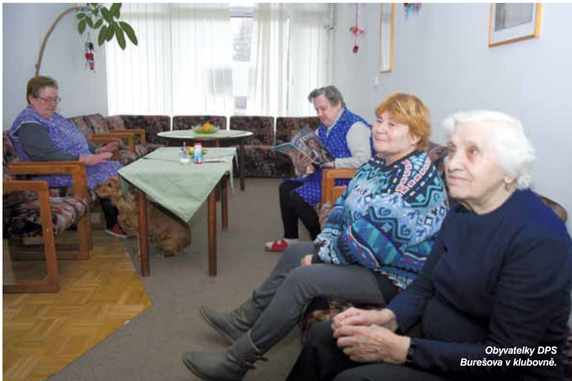
Obyvatelky DPS Burešova v klubovně.

Podporujeme komunikaci, pocit užitečnosti a potěšení z činností, které jsou v možnostech klienta. Lékařská péče je zajišťována lékaři Gerontologického centra Prahy 8. Součástí je i individuální psychologická péče.