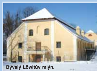
Bývalý Löwitův mlýn.

Městská část Praha 8 se sídlem orgánů Zenklova 35, 180 48 Praha 8 - Libeň v y h l a š u j e