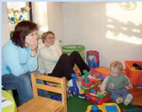
Mateřské centrum Benjamin nabízí matkám a dětem možnost her a vzájemných setkání.

Po řadu let poskytujeme duchovní podporu (pastoraci), a to i za hranicemi působnosti našeho farního sboru - například v Hospici Štrasburg v Bohnicích.