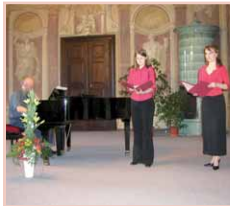
První účinkující Libeňského jara mladých se divákům představí 12. května 2006.

Budu-li hovořit pouze o veřejných akcích, tak vedle tradičních (koncerty, výstavy, cestopisné projekce, oslavy Dne dětí a Vánoc aj.) budeme v průběhu celého roku představovat novinky z oblasti