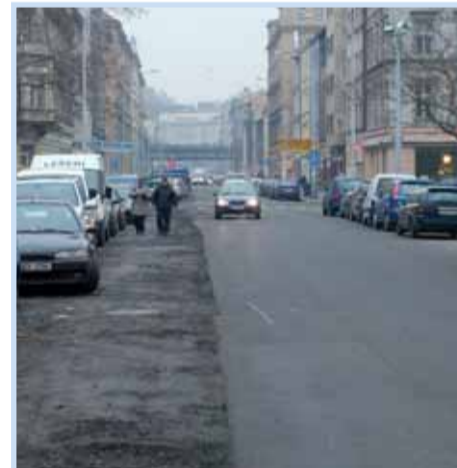
V letošním roce bude dokončena popovodňová obnova Karlína. Obnovy se v letošním roce dočká zbylá část Křížkovy ulice, od Karlínského náměstí až po Florenc. Její podoba bude po opravě stejná, jako u první části (od Karlínského náměstí k Hybešově ulici).

a peníze na to máme. Jednal jsem o tomto plánu i s Technickou správou komunikací, protože jde o její silnici a TSK je také připravena změny na Palmovce provést. Když jsme u Palmovky, tak mám pro čtenáře Osmičky jednu úplně čerstvou zprávu. Spolu s Dopravním podnikem plánujeme odhlučnění tramvajové trati v ulici Na Žertvách.