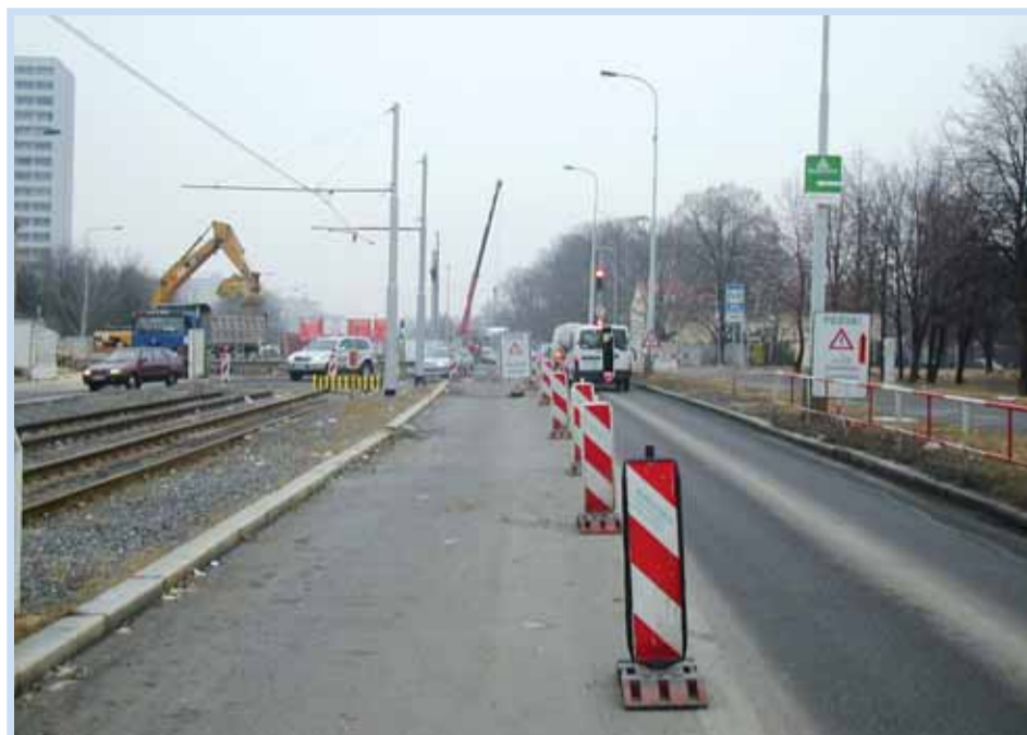
Letošní rok bude ve znamení snižování počtu záberů ve Střelničné ulici. „Až dojde k zakrytí tunelu pro metro, ty největší zábery, kvůli kterým se dnes jezdí jen po půlce Střelničné, začnou mizet,“ řekl Osmičce radní pro dopravu Radovan Šteiner.

Myslím, že mohu čtenáře Osmičky potěšit. Z hlediska rekonstrukcí tramvajových tratí by nás letos nemělo čekat nic zásadního. Loňský rok byl z tohoto pohledu velice intenzivní. Ale právě díky tomu se podařilo získat náskok, takže letošní rok bude pro lidi z Prahy 8 podstatně klidnější. Hodně