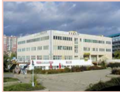
Projekt obnovy kulturního domu Krakov je připraven.

V rozpočtu na tento rok jsou, ve srovnání proti těm předchozím, připraveny peníze na projekty Evropské